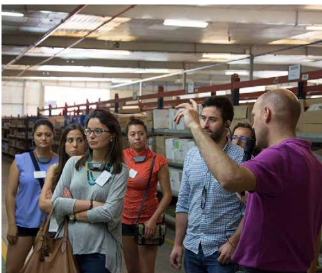
Visita a las instalaciones de Royo Group