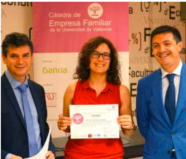
Entrega de diplomas a los estudiantes